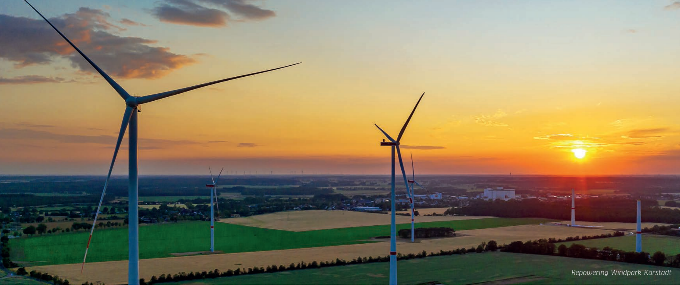
Repowering Windpark Karstädt

Unter der TOP 5 weltweit bei erneuerbaren Energien.